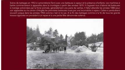
Scène de battage en 1952 à Lencquesaia (Terceira) avec une batteuse à vapeur et la présence d'enfants. Les machines à battre commencent à apparaître dans le paysage à partir des années 1950. Il s'agit tout d'abord de batteuses à manège actionnées par la force animale, généralement une paire de vaches. Il fallut attendre les années 1980 pour voir apparaître sur le terrain d'Argélia les premières batteuses mues par une locomotive à vapeur. Celle-ci évoluait souvent jusqu'à dans les années 1990 comme c'est le cas. À la fin des battages comme à la fin de tous les grands travaux agricoles on procédait à un repas et à une petite fête dénommée solista.