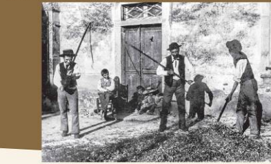
Scène de battage au Rieu à Saint-António-Nobre-Vel (Terceira-Gonçalo) vers 1885. Le battage au Rieu nécessitait une coordination assez stricte qui nécessitait des mouvements et les batteurs devaient en maintenir parfaitement rythme et cadence. Scène d'escodade avec la Rigal à Saint-António-Nobre-Vel (Terceira-Gonçalo) vers 1885. Par escodade avec la Rigal était une construction à l'usage variable et matériel de mouvement et cela que les escoderos ne captivaient comme ça la rigal ou la cadence.