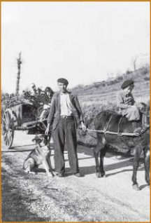
À Argelas, dans les années 1940, un bœuvier mène un attelage de deux mules qui tractent une charrette avec un chargement de bois. À Argelas, dans les années quarante, un bœuvier mène un attelage de deux mules qui tractent une charrette avec un chargement de bois. Scène d'une charrette. Quand le charroto passe / Ça pour le four / Marçon Fagacha / L' / qu'il a dit.