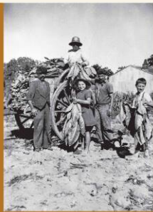
Cultivadora de tabaco a Senecos (Terceira) em 1974. Devantants fort passer des paquets de feuilles de tabac à un homme ou à une femme sur un chariot. Dans le paysage cette culture se développe essentiellement après la seconde guerre mondiale. Entrée d'une charrette. C'est ça que le tabac / Et une plante appelée. / C'est ça que le tabac / A la fin, les enfants. Cultura del tabaco a Senecos (Terceira) em 1974. Dos droles fan passar de paquetes de folhas de tabaco a um homem ou a uma mulher por um charroto. / Pal Senecos, questa cultura se desenvolveu depois que houve a segunda guerra mundial.