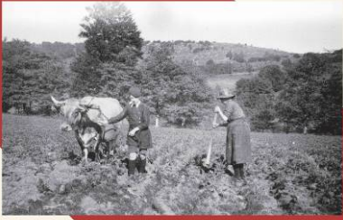
Seillage ou battage des pommes de terre à Lencquesaia (Terceira), dans les années 1940. Une femme mène le socle, un enfant mène un bœuf. Soutirage et caillage de la sève à la Montebana (Terceira) dans les années 1940. Une femme mène le socle, un bœuf mène un bœuf.